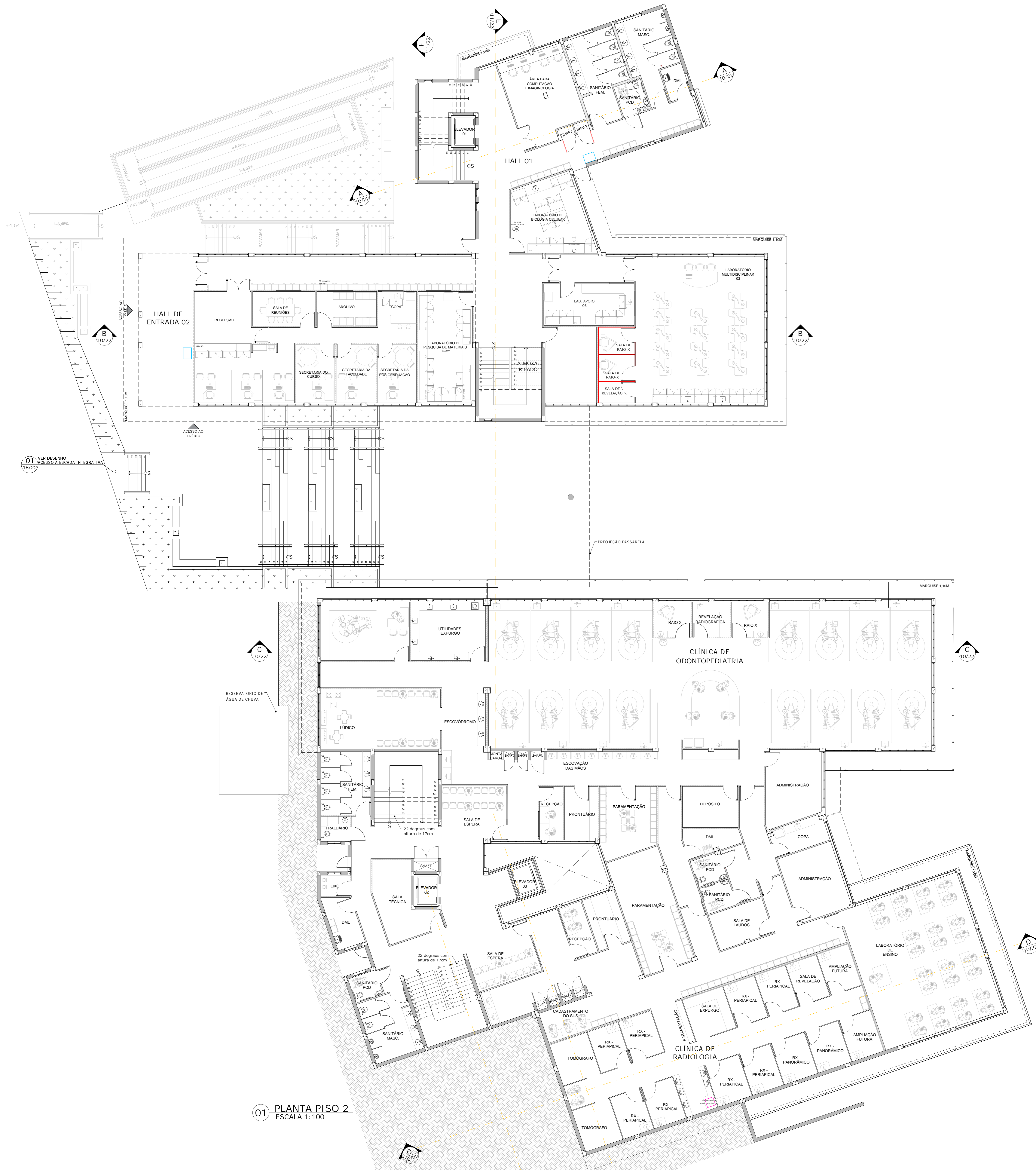
01 PLANTA PISO 2 ESCALA 1:100