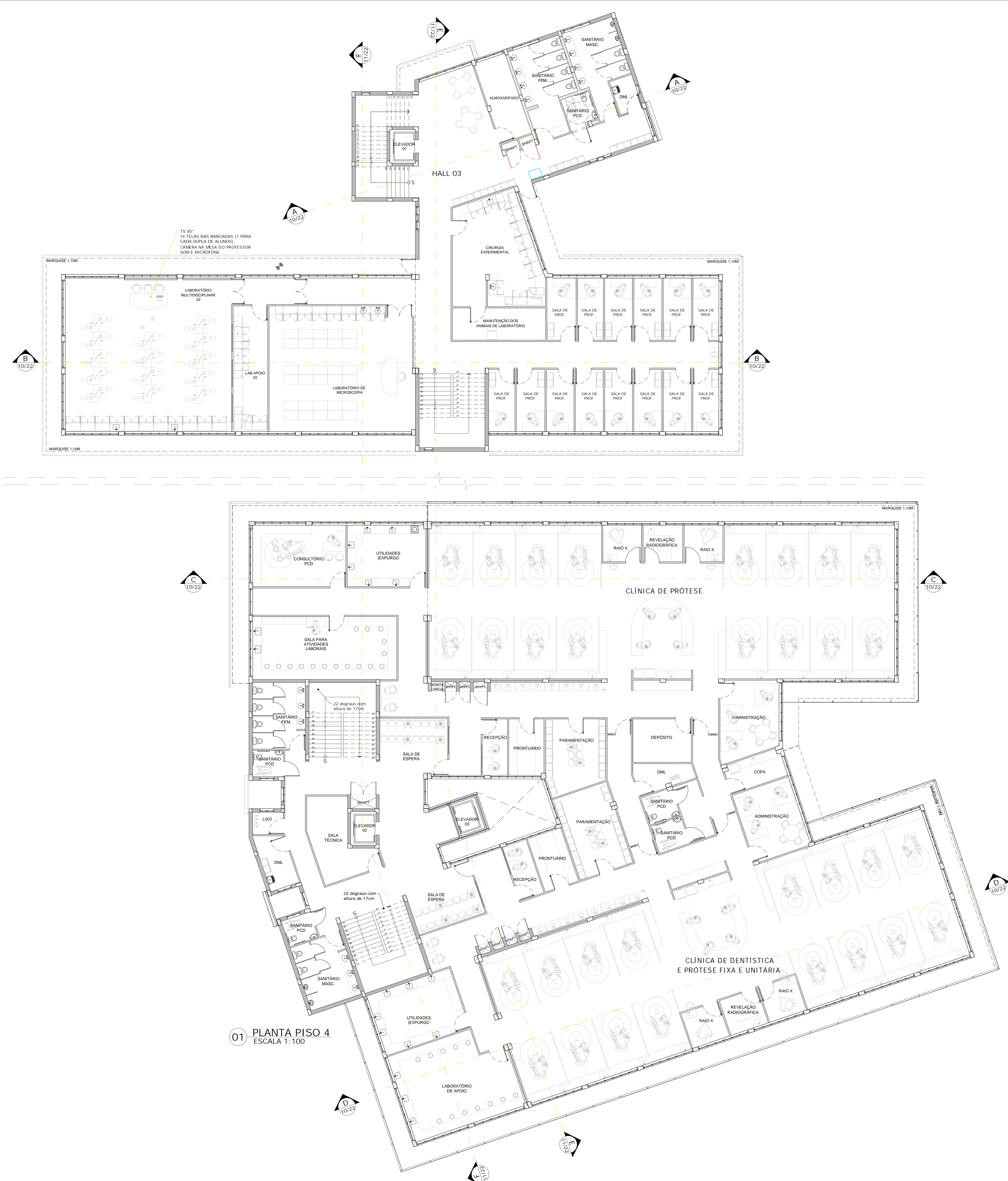
01 PLANTA PISO 4 ESCALA 1:100