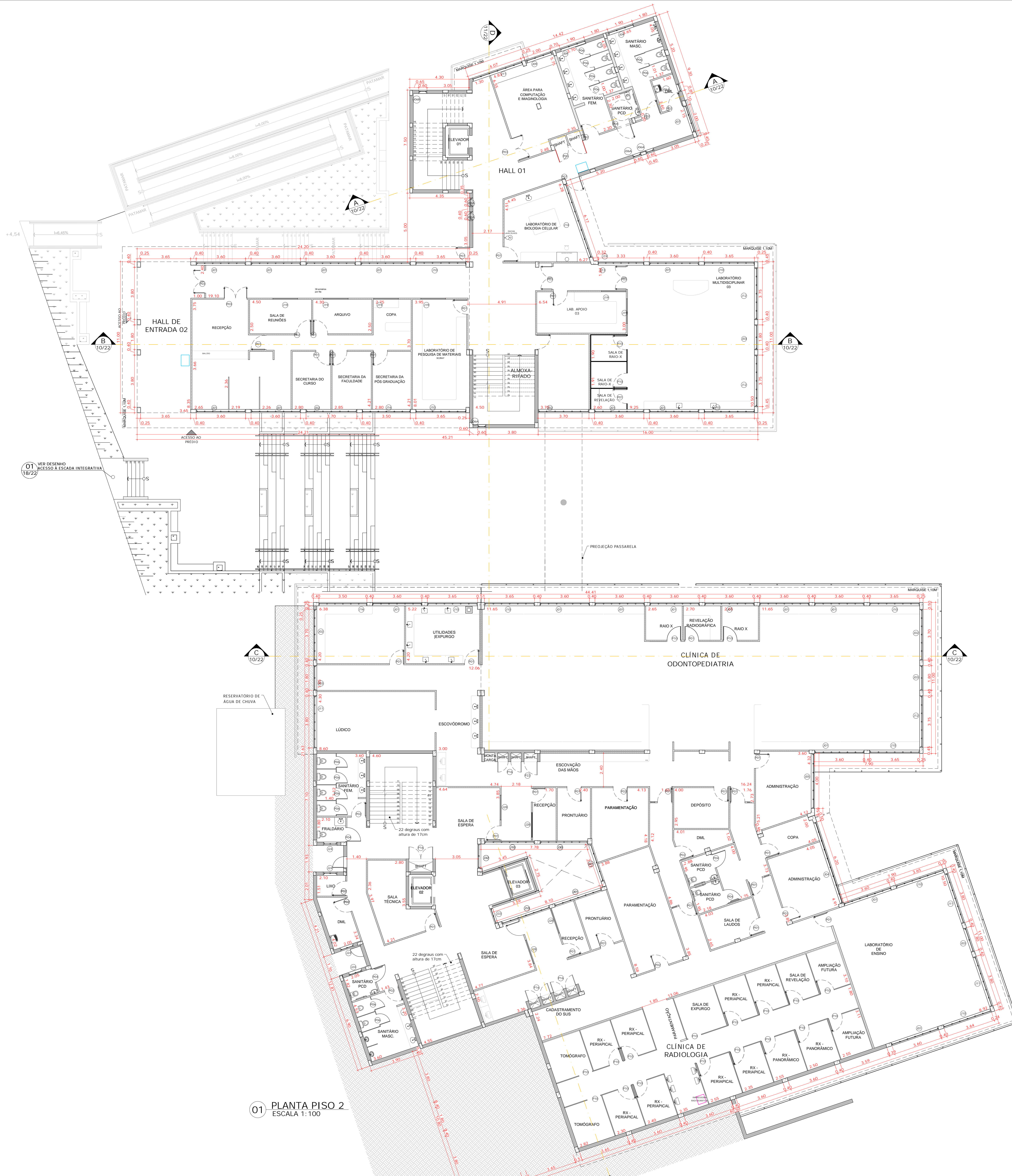
01 PLANTA PISO 2 ESCALA 1:100