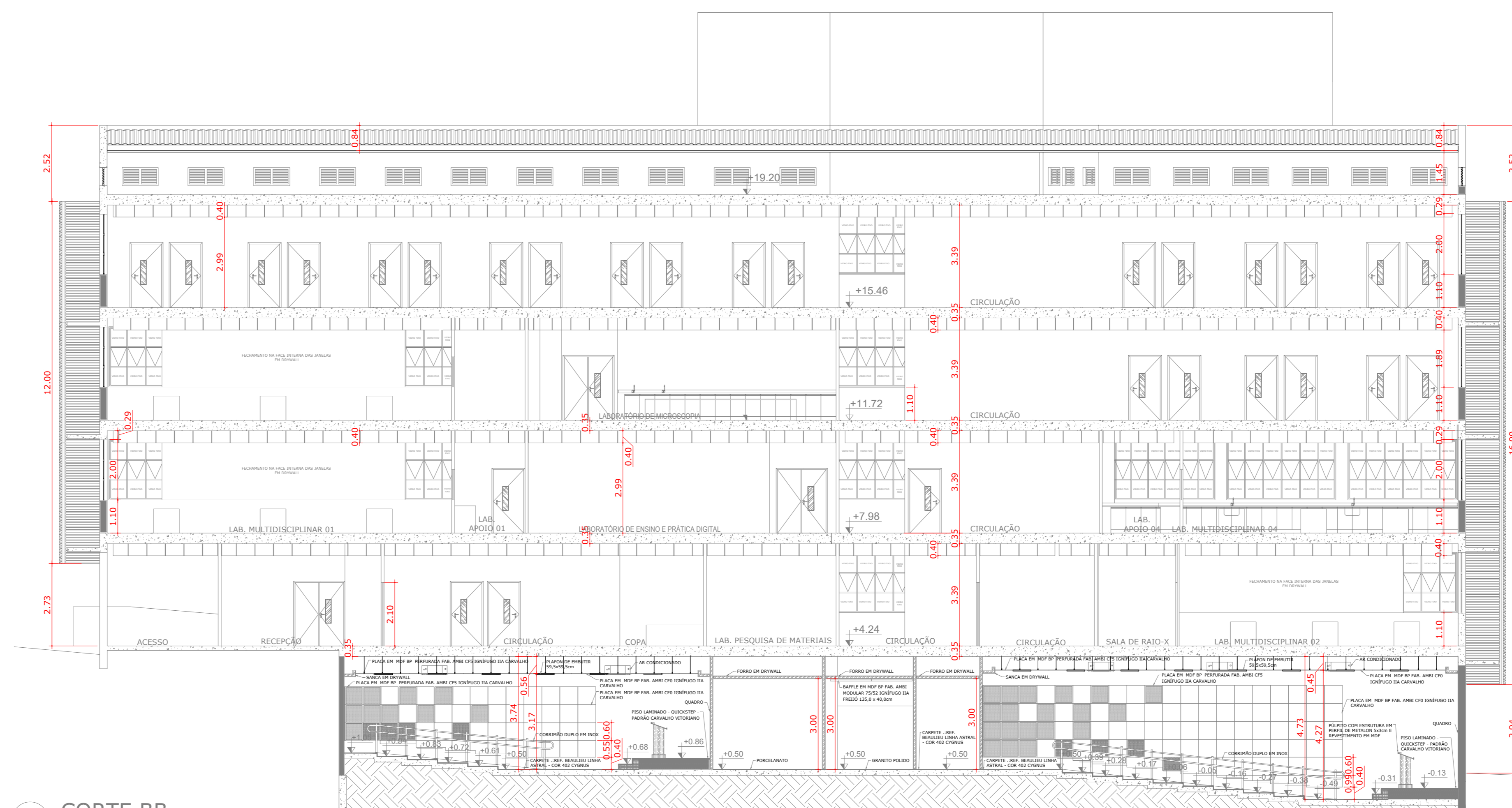
02 CORTE BB ESCALA 1:100