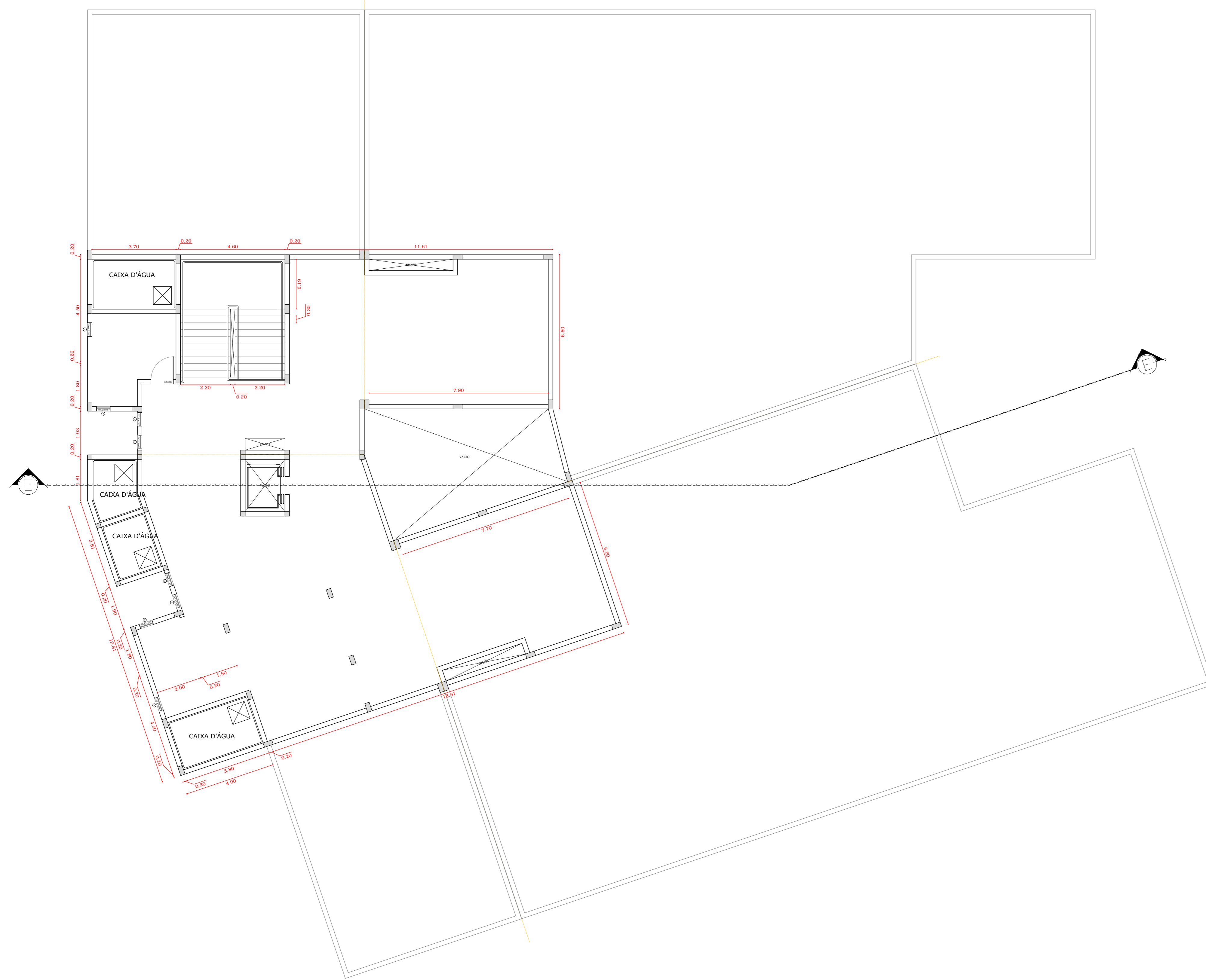
15 PISO TÉCNICO ESCALA 1:100