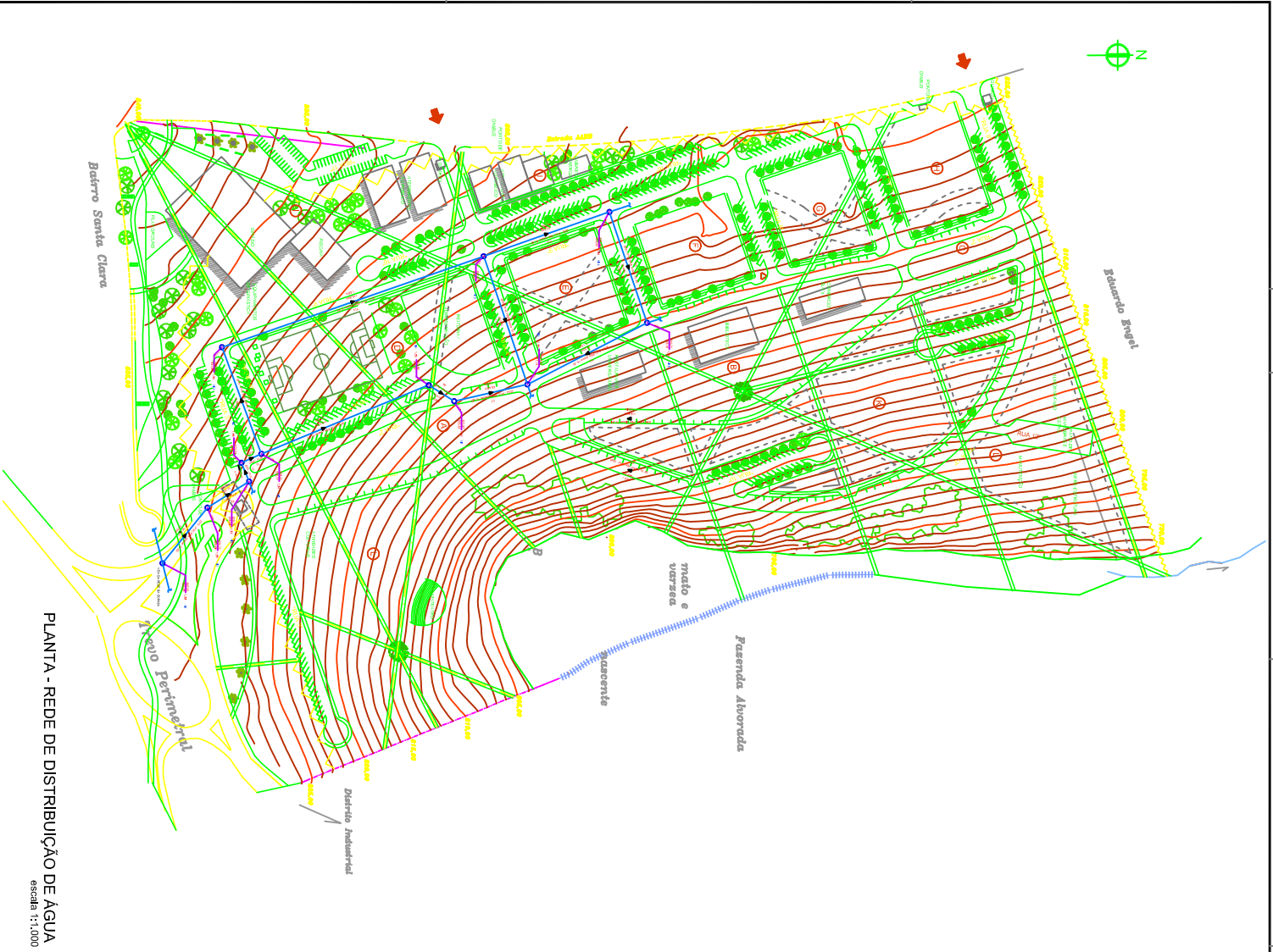
PLANTA - REDE DE DISTRIBUIÇÃO DE ÁGUA escala 1:1.000