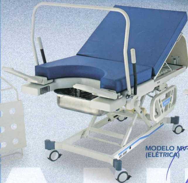
MODELO MV-6090 (ELÉTRICA)