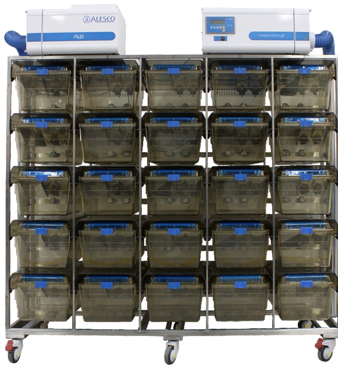
Rack de 50 é um de 25 duplo Mini-Isoladores não inclusos