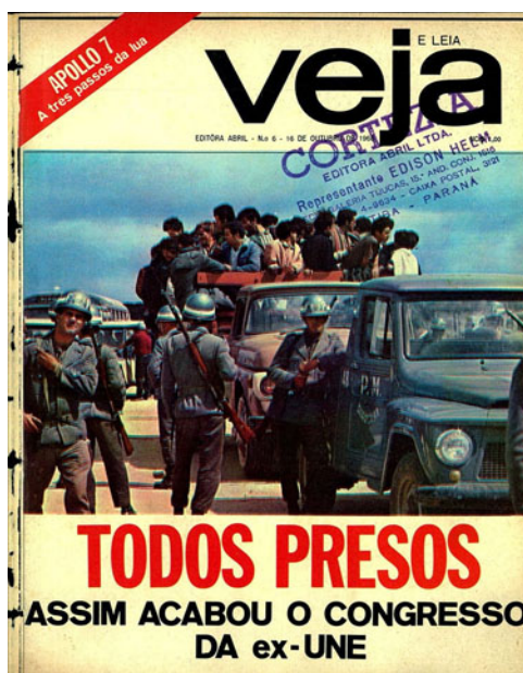
Figura 2: Capa da revista Veja