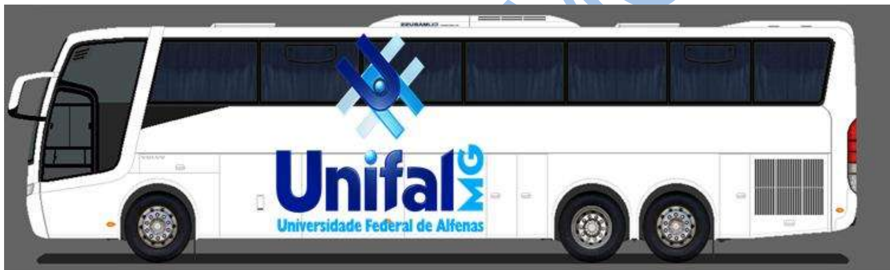
VEÍCULO FROTA Nº 32 – B12R – CAPACIDADE 52 PASSAGEIROS